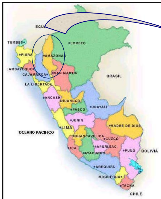
MAPA DEL PERÚ