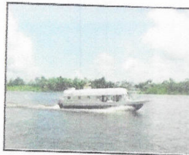
MOTONAVE (RAPIDO - EXPRESO)