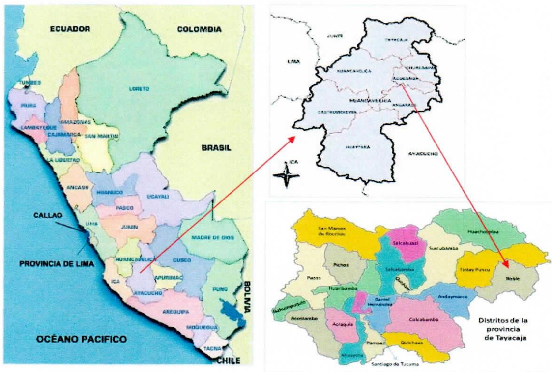
Ilustración 1: Mapa de macrolocalización del área de influencia

El consultor, también deberá de tener en cuenta que en el Centro Poblado de Roblepampa existe un total de 130 agricultores y que cada uno posee 3 hectáreas en los cuales tienen cultivos de frutales, café, palto y limones.