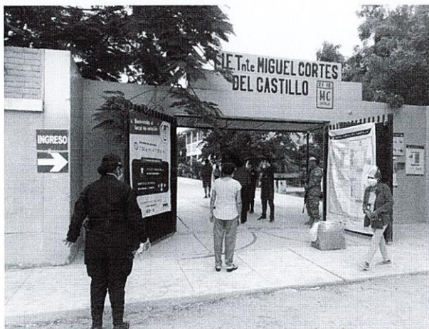
Castilla, Noviembre - 2024

"MEJORAMIENTO DEL SERVICIO DE EDUCACIÓN INICIAL, SERVICIO DE EDUCACION PRIMARIA Y SERVICIO DE EDUCACIÓN SECUNDARIA EN I.E. TENIENTE MIGUEL CORTES DEL CASTILLO DISTRITO DE CASTILLA DE LA PROVINCIA DE PIURA DEL DEPARTAMENTO DE PIURA".