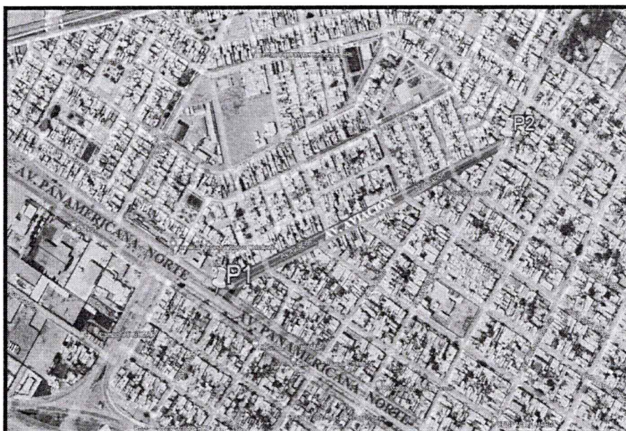
VISTA PANORÁMICA DEL AREA DE ESTUDIO