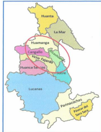
Imagen: Mapa de localización de la Provincia de Huamanga.