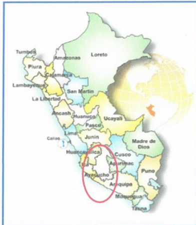
Imagen: Mapa de localización del Departamento de Ayacucho y de la Provincia de Huamanga.