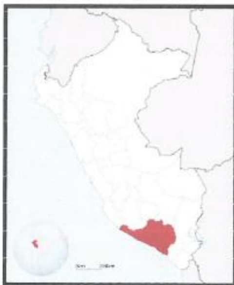
Departamento de Arequipa