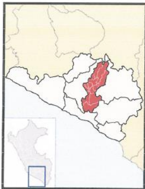
Provincia de Castilla