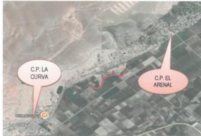
Gráfico 02 Ubicación de la zona donde se desarrollará la SEGUNDA ETAPA del proyecto