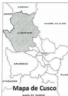
Mapa de Cusco