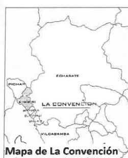
Mapa de La Convención