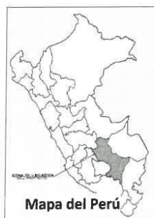
Mapa del Perú