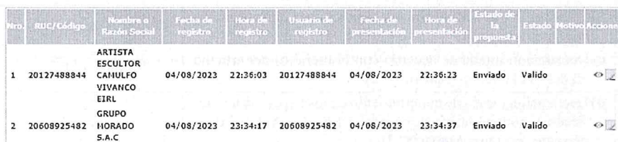
Imagen N° 01

Conforme a lo programado en el cronograma del procedimiento de selección, la presentación de ofertas (electrónica) se realizó el 04 de agosto de 2023 (00:01 a 23:59 horas). Habiéndose cumplido dicho plazo, el 07 de agosto de 2023 el comité de selección procedió a verificar las ofertas presentadas a través del Sistema Electrónico de Contrataciones del Estado – SEACE, figurando lo siguiente: