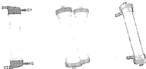
Fig.1: Dializador para Hemodiálisis de Bajo Flujo de Membrana Sintética (No implica diseño)