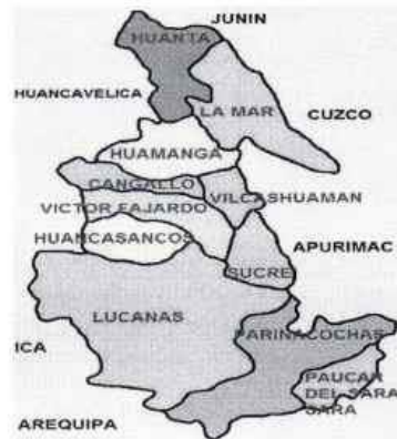
FIGURA N° 1.2