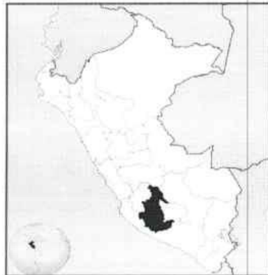
FIGURA N° 1.1