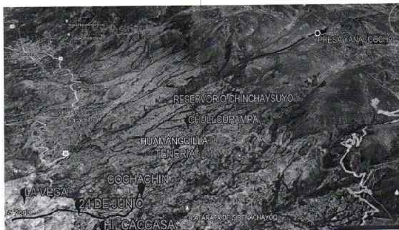
FIGURA Nº1.4 AREA DE ESTUDIO