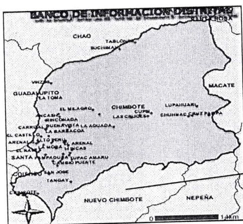
PROV. DEL SANTA