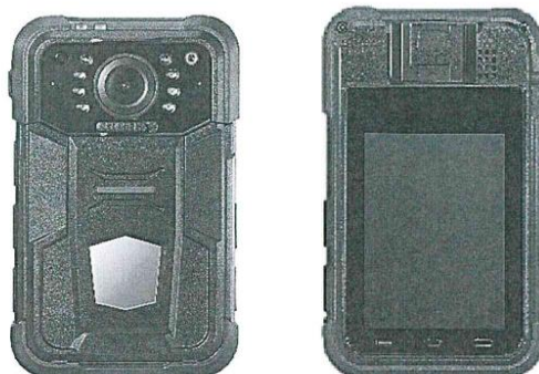
Imagen Referencial: Cámara Corporal