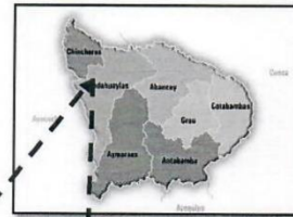
MAPA DE APURÍMAC