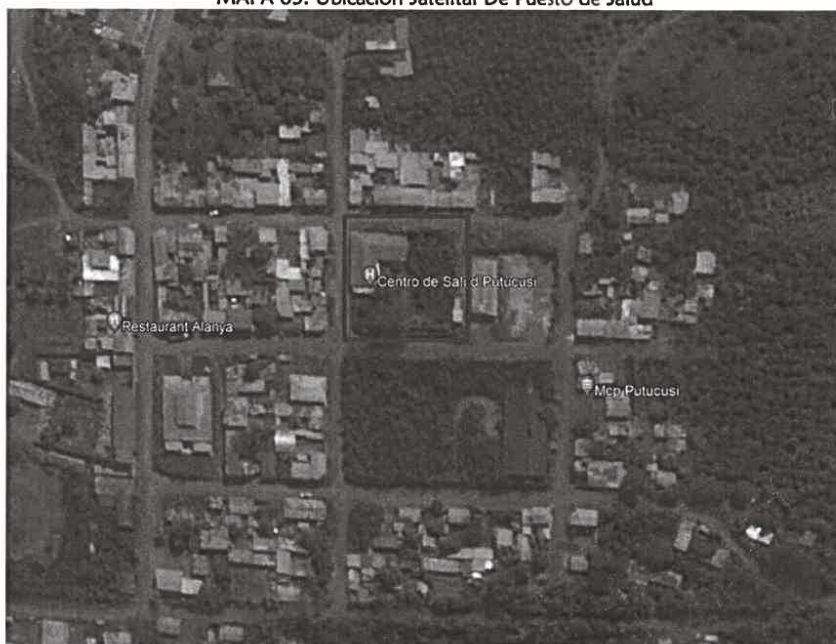
MAPA 03. Ubicación Satelital De Puesto de Salud