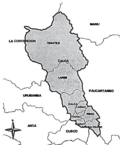
MAPA 02: Ubicación Geográfica Distrito de Yanatile