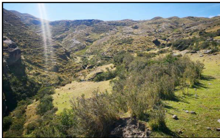
Fuente principal captación de riachuelos Unuraquirayoc y Carneseroyoc

Actualmente no existe en la comunidad de Cusibamba sector Mutuycanchapata una infraestructura de almacenamiento la cual abastezca como principal fuente de recarga de los ojos de agua, sin embargo, existe un buen potencial hídrico en el sector para poder realizar la siembra de agua y respectiva cosecha de la misma.