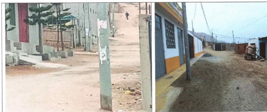
VÍAS EN MAL ESTADO, NECESITAN UN TRATAMIENTO ADECUADO SE REALIZARÁN NUEVOS TRABAJOS DE MEJORAMIENTO A LO LARGO DE LA VÍA

Es entonces, ahora, que el Gobierno Local, priorizó y aprobó la solicitud de la población comprometiéndose a llevar adelante tal petición y lograr hacer realidad el proyecto denominado “MEJORAMIENTO DEL SERVICIO DE TRANSITABILIDAD VEHICULAR Y PEATONAL DE LA CALLE 10, CUADRAS 4,5,6,7,8,9,10,11,12, CALLE 24 CUADRAS 3,4,5 EN EL AA.HH. LA FLORIDA DEL DISTRITO DE ATICO - PROVINCIA DE CARAVELI - DEPARTAMENTO DE AREQUIPA”, ya que contar con estos servicios básico es de vital importancia para tener una vida de alguna manera decorosa.