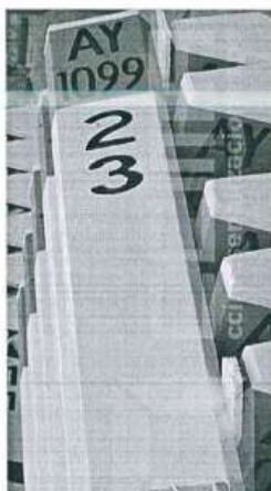
Imagen referencial N°02

Se pintará los hitos kilométricos de fondo color blanco, letras color negro y color cabezal naranja.