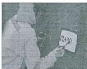
Imagen referencial N°01

Se pintará las progresivas de fondo color blanco, letras color negro, y escritura de la siguiente manera por ejemplo 02+300.