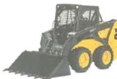
Imagen referencial de minicargador frontal de 90 HP

ING. BENJAMIN HUANC C.O. N° 201546 RESIDENTE