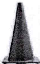
CONO DE SEGURIDAD