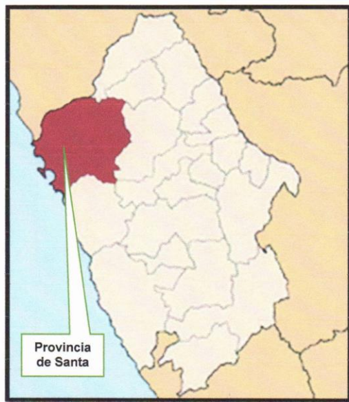
Imagen N°02: Ubicación del Distrito de Samanco en el Departamento de Ancash

"Año Del Bicentenario, De La Consolidación De Nuestra Independencia, y De La Conmemoración De Las Heroicas Batallas De Junín Y Ayacucho"