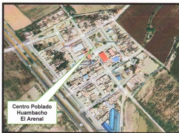
Imagen N°04: Ubicación del Centro Poblado Huambacho El Arenal