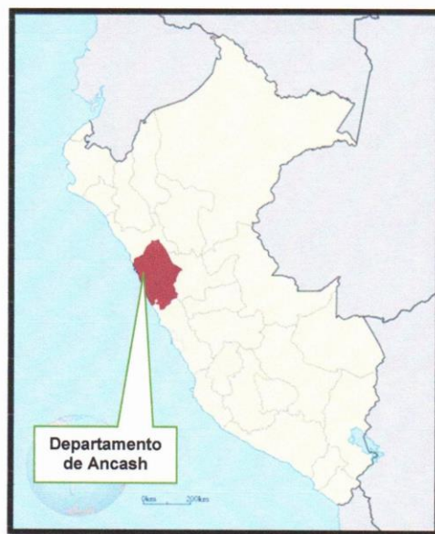
Imagen N°01: Ubicación del Departamento de Ancash

Departamento : Ancash Provincia : Santa Distrito : Samanco Centro Poblado : Huambacho el Arenal