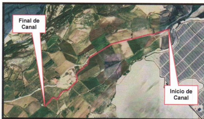
Imagen N°05: Ubicación del canal de Caycay

Se encuentra ubicado a 9°15' 9.96" de latitud sur; a 78° 24' 23.28" de longitud oeste y a 58 metros de altitud, al norte del Perú. El Código Ubigeo del Distrito de Samanco es 021807. El Canal tiene una longitud de 1+495 km.