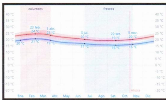
Imagen N°07: Temperatura máxima y mínima promedio en Samanco