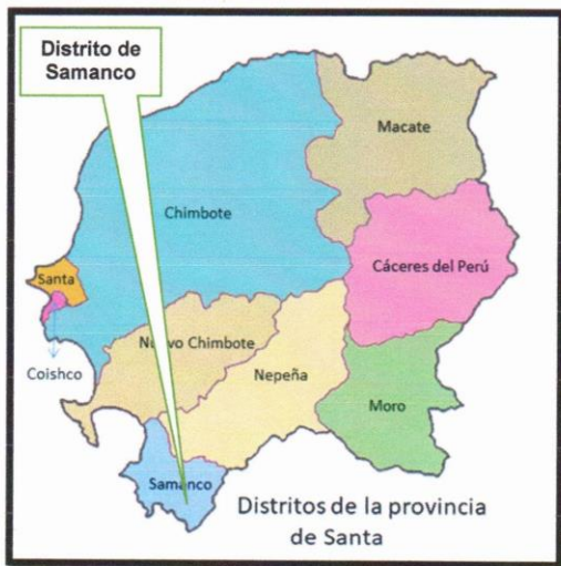
Imagen N°03: Ubicación del Distrito de Samanco en la Provincia de Santa