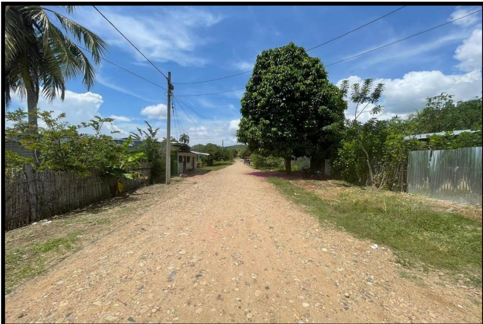
JR. SARGENTO LORES C-04: Se aprecia que no existen características de veredas urbanas que conecta las vías urbanas. No existe cunetas para los drenajes pluviales. Vías con un afirmado muy desgastado. Luminarias públicas que dan el orden público.