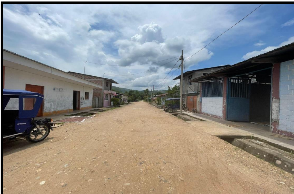
JR. BOLOGNESI C-04: Se aprecia que las veredas urbanas que conecta las vías urbanas se encuentran en mal estado. las cunetas para los drenajes pluviales en mal estado. Vías con un afirmado muy desgastado. Luminarias públicas que dan el orden público.