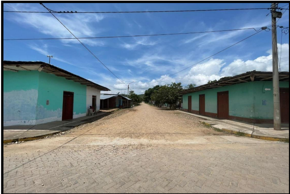
JR. SARGENTO LORES C-03: Se aprecia que no existen cunetas para los drenajes pluviales. Vías con un afirmado muy desgastado. Arborización que enriquecen el perfil urbano.