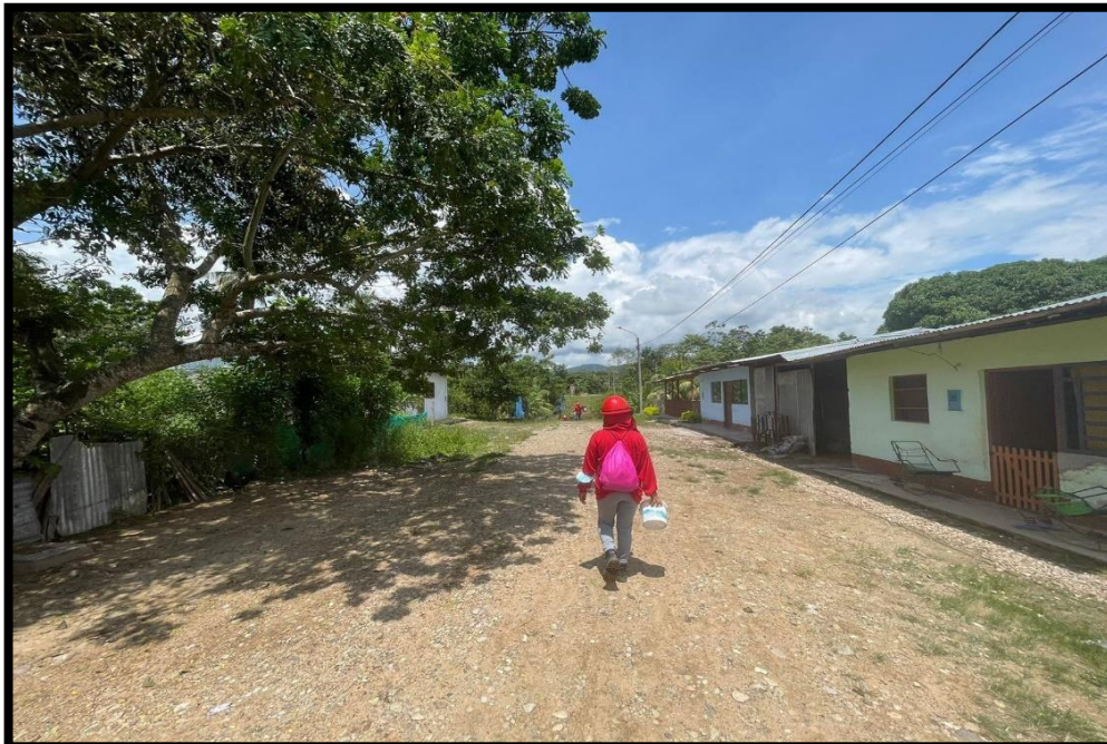
JR. MIGUEL GRAU C-07: Se aprecia que no existen características de veredas urbanas que conecta las vías urbanas. No existe cunetas para los drenajes pluviales. Vías con un afirmado muy desgastado.