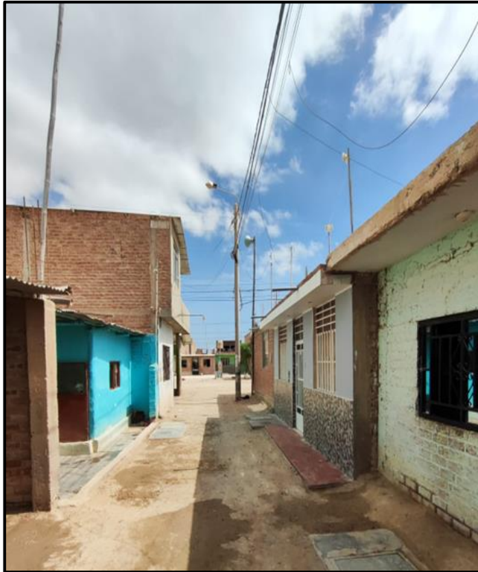
PASAJE LOS GERANIOS