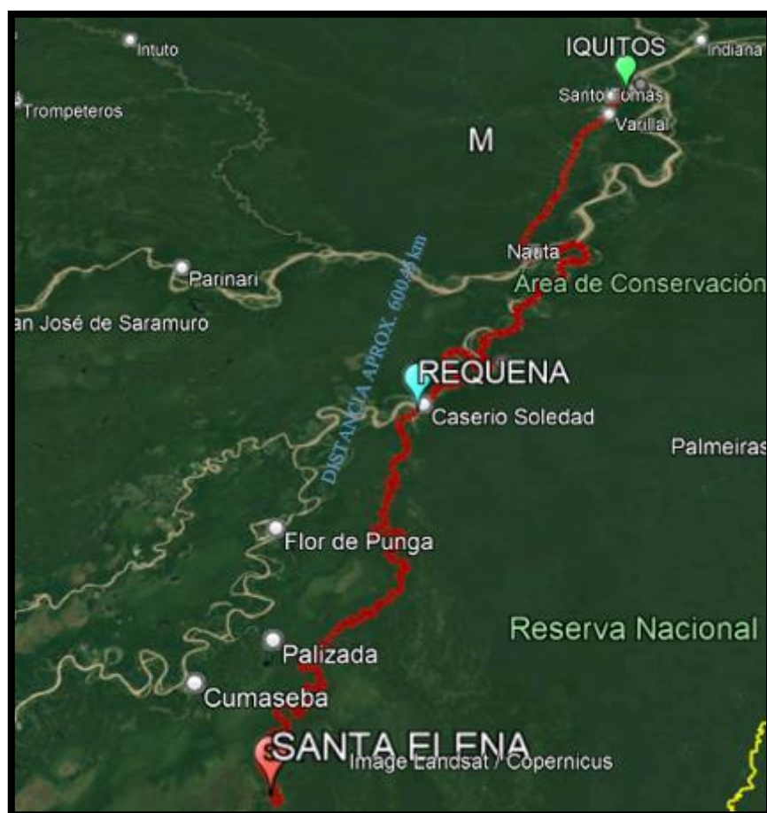
Fig. 04 Imagen Satelital de la Vía de Acceso Iquitos – Santa Elena