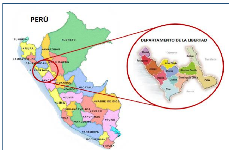
IMAGEN 01. UBICACIÓN GEOGRÁFICA DE LA REGIÓN LA LIBERTAD

Región geográfica : Sierra Coordenadas UTM : Zona 17 826129.37 E 9134280.97 N