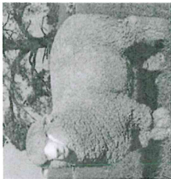
Imagen referencial de ovina raza Corriedale Hembra reproductor