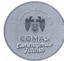
Logo de la Entidad