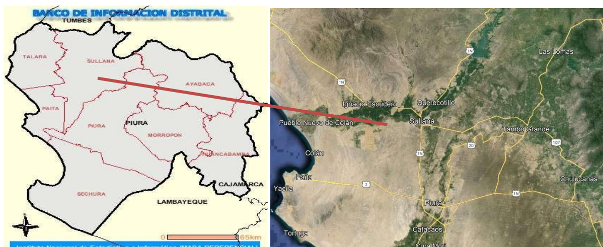
Figura 1. Ubicación departamental