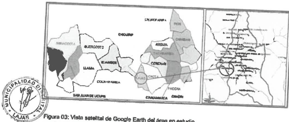
Figura 03: Vista satelital de Google Earth del área en estudio.