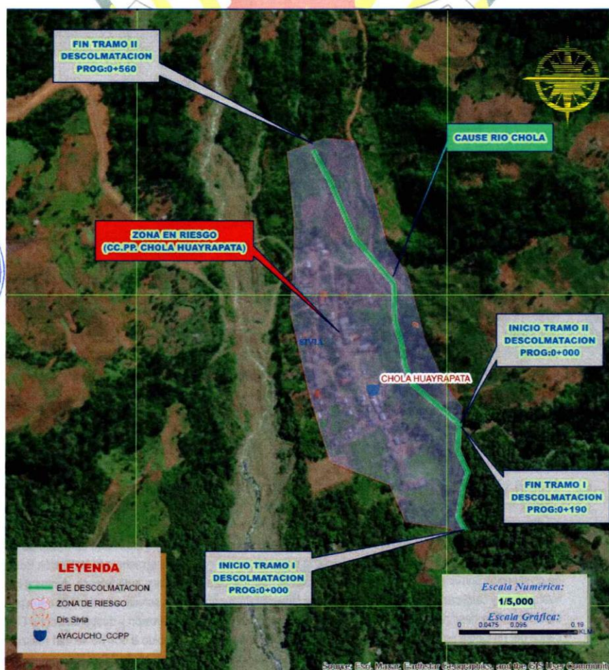
MAPA DE UBICACIÓN GEOGRÁFICA