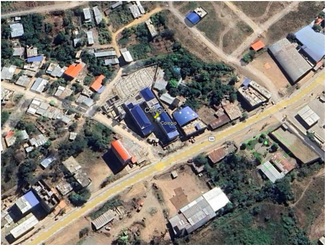
IMAGEN N° 01: VISTA SATELITAL DE LA INSTITUCION EDUCATIVA