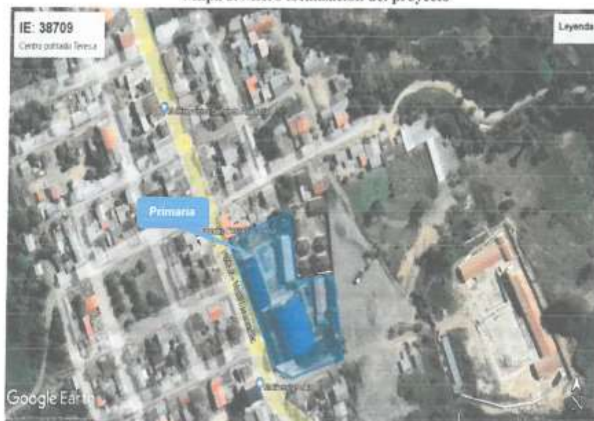
Mapa 2. Micro localización del proyecto