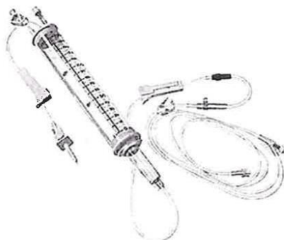
Fig. 1.: Línea para Bomba de Infusión con Volutrol (No implica diseño)