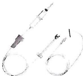
Fig. 1.: Línea para Bomba de Infusión sin Volutrol (No implica diseño)