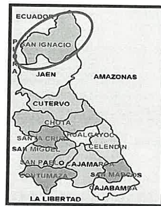
Grafico N°03: Ubicación de Jaén y sus Distritos

Distritos de la provincia de San Ignacio