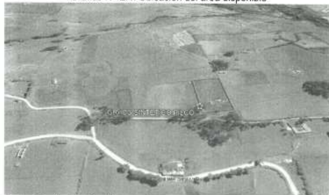
Grafico N° 2.4: Ubicación del área disponible