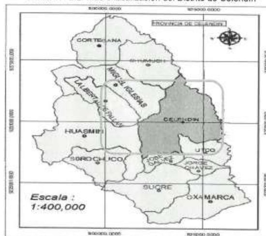
Grafico N° 2.2: Macro localización del Distrito de Celendin