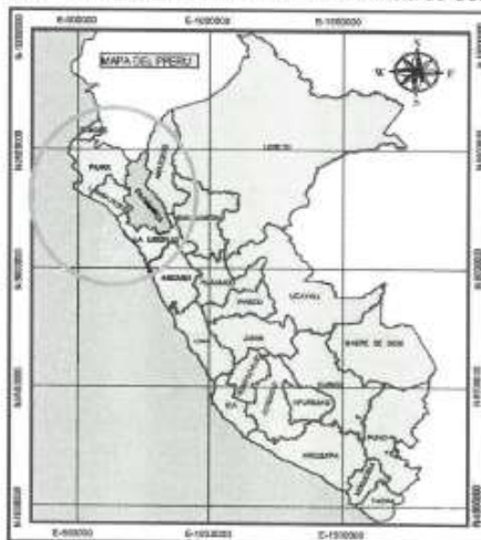
Gráfico N° 2.1: Macro localización de la Provincia de Celendín.