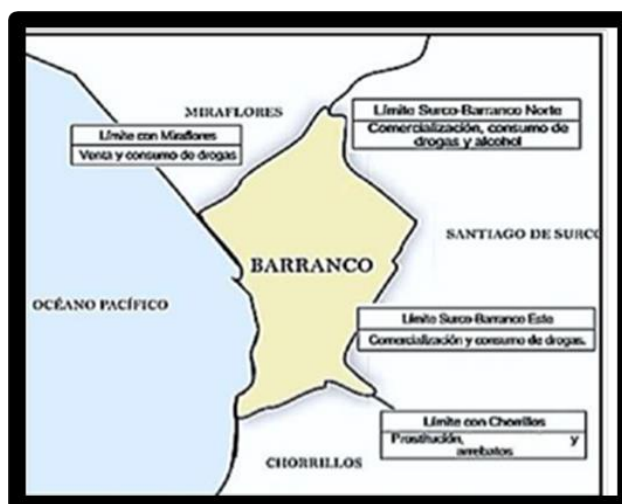
Mapa N° 1: Ubicación y Localización