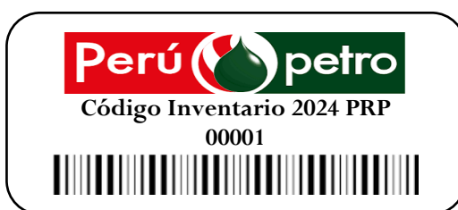
Imagen 01: Activos No Críticos

Se podrá utilizar de material poliéster autoadhesivo, con letras y números de color negro, con una medida de 2.5 cm de alto y 5.0 cm de ancho aproximado, como también se podrá utilizar una etiqueta transparente autoadhesiva de 3.0 cm x 5.50 cm como protección de la etiqueta del código inventario.