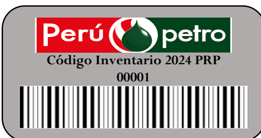
Imagen 02: Activos Críticos

Se podrá utilizar de material de metal, placas, láminas, entre otros. Con una medida de 2.5 cm de alto x 5.0 cm de ancho aproximado.