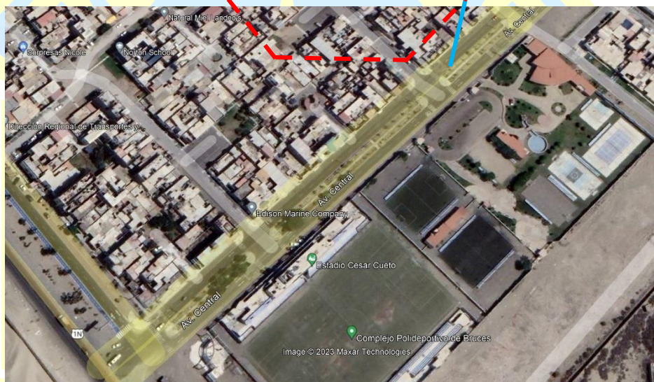
Micro Localización (Distrito Nuevo Chimbote) – PROGRAMA DEL VASO DE LECHE - NUEVO CHIMBOTE