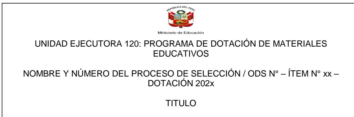
FIGURA N° 04