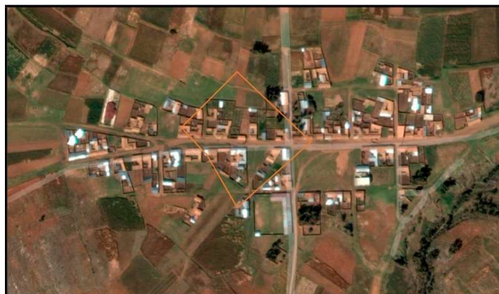
GRAFICO 04.- LOCALIZACION DE LA COMUNIDAD DE CRUZ PAMPA