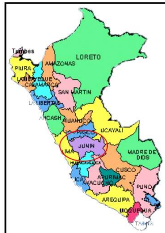
GRAFICO 01.- UBICACIÓN REGIONAL