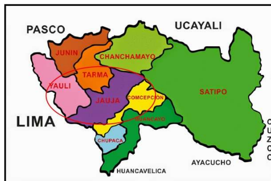
GRAFICO 02.- UBICACIÓN PROVINCIAL