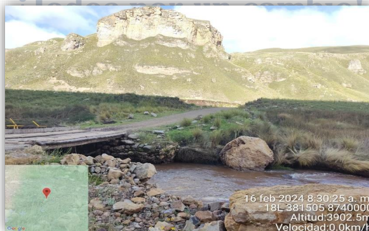
Fig. 4: Vista Actual del Puente