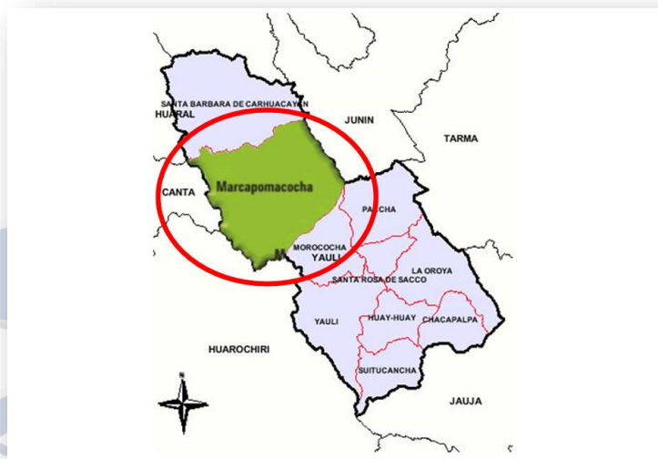
Fig. 3: Ubicación Geográfica Satelital del Proyecto