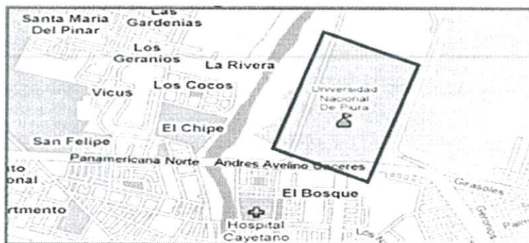
Imagen N° 02

El objetivo de la presente es contratar a la Persona Natural o jurídica que cuente con Registro Nacional de Proveedores con inscripción Vigente como Consultor de Obras en la Especialidad de Obras Urbanas, Edificaciones y Afines, que se encargue de elaborar los Estudios definitivos del Expediente Técnico del Proyecto: "MEJORAMIENTO DEL SERVICIO DE FORMACIÓN DE PREGRADO EN EDUCACIÓN SUPERIOR UNIVERSITARIA EN ESCUELA PROFESIONAL DE ADMINISTRACIÓN DE LA UNIVERSIDAD NACIONAL DE PIURA DISTRITO DE CASTILLA DE LA PROVINCIA DE PIURA DEL DEPARTAMENTO DE PIURA" CUI N°2615909, el Expediente Técnico estará constituido por planos de ejecución de obra, por especialidades, especificaciones Técnicas, metrados, presupuestos de obra, análisis de precios unitarios, calendario de avance de obra valorizado, formulas polinómicas, cronogramas de ejecución, memoria descriptiva, gastos generales, resumen de insumos, y si el caso lo requiere, estudios de suelos, estudio geológico, u otros complementarios, relación de ensayos y/o pruebas que se requieran, así mismo términos de referencia para capacitación de ser necesario técnicas para la adquisición de mobiliario y equipos.