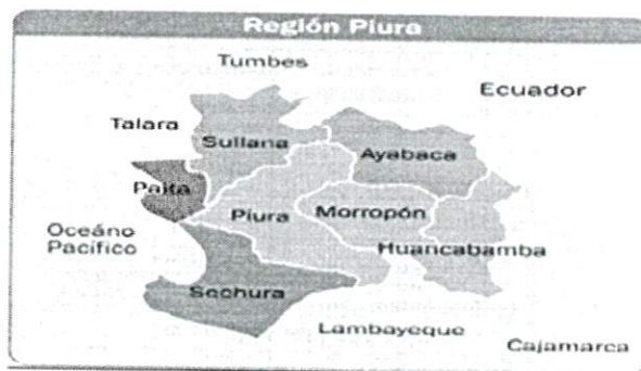
Imagen N° 01

Piura es una provincia del noroeste del Perú situada en la parte central del Departamento de Piura, Limita con la Provincia de Paita y de Sullana al Noroeste, con las de Ayabaca, Morropón y Lambayeque por el este, y con la Sechura por el suroeste. Su capital es la ciudad de Piura.