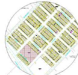
PLANO DE LOCALIZACIÓN Escala: 1:2000