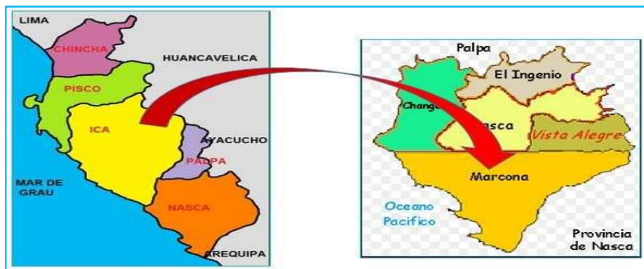
Ilustración N° 2 - Localización del Distrito de Marcona