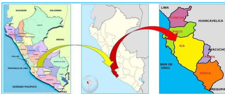
Ilustración N° 1 - Localización del Departamento de Ica y de la Provincia de Nasca