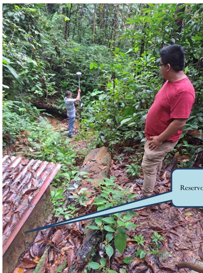
Reservorio existente 6.00 m 3

Almacenamiento: En la actualidad existe un reservorio de 6 m 3 de capacidad, creado por los mismos moradores que con el crecimiento poblacional no abastece la demanda del servicio, así mismo estas instalaciones tienen una antigüedad de 10 años aproximadamente por lo que se encuentra en estado de deterioro y deficiencia, cabe indicar que las instalaciones no son las adecuadas debido a que realizaron sin una adecuada ingeniería.