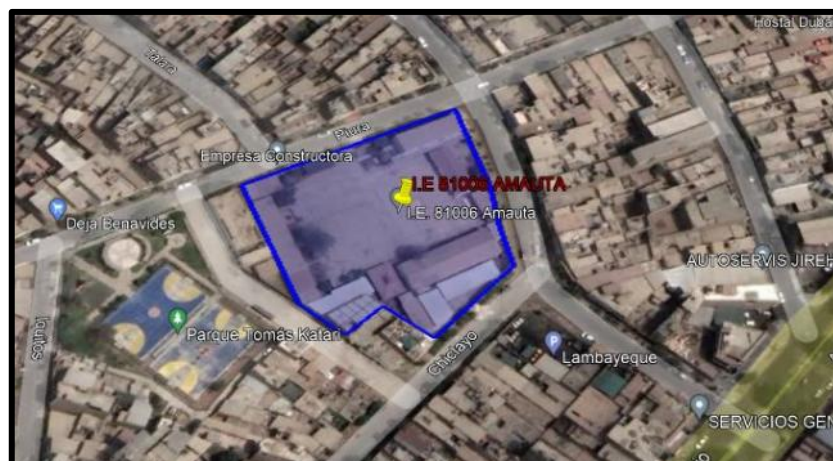
Ilustración 1- Ubicación del terreno

Región : La Libertad Provincia : Trujillo Distrito : Trujillo Dirección : Calle Piura N°350, MZ. K Lote 1 Urbanización : Aranjuez