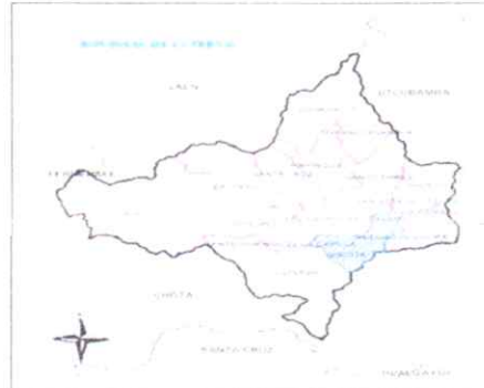
Mapa de la Provincia de Cutervo