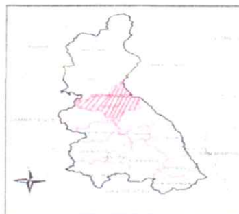
Mapa de la Región Cajamarca