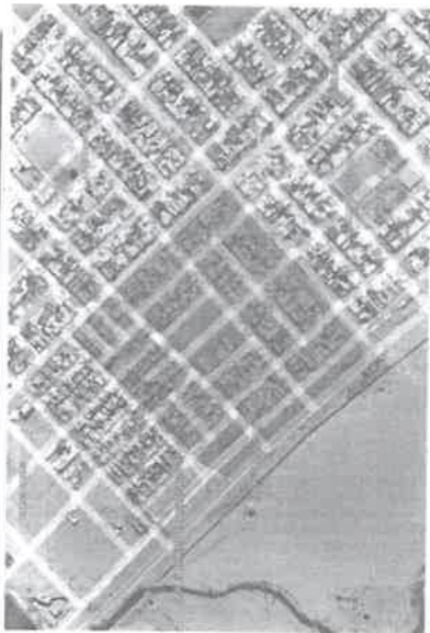
Imagen 01.- Donde se ubicará el Proyecto