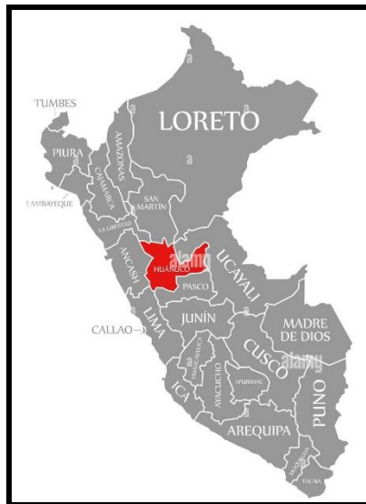
Fig. 01: Ubicación del Centro poblado Unión 3 de Mayo

Longitud : -9.44223 Altitud : 248 m.s.n.m.